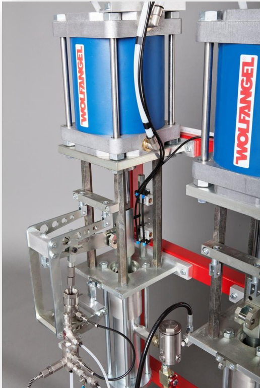
Gelcoater 150 AM

Gelcoat external mix with optional 2nd colour