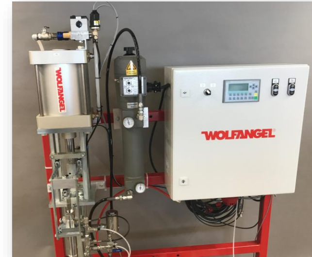
Gelcoater 150 with optional gelcoat heater and Spray Progress Display