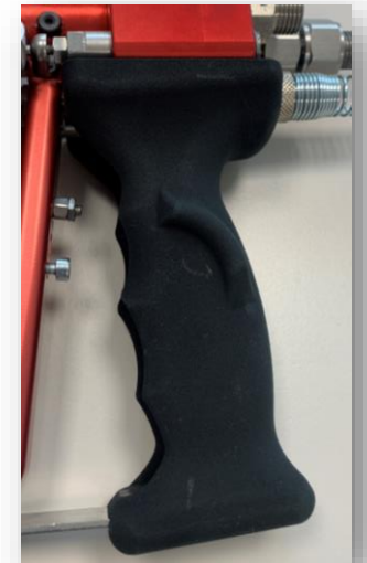
ergo handle right-handed