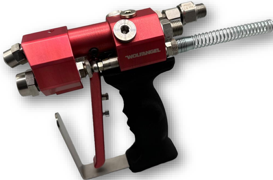
ergo.gun EG Gelcoat Außenmischung