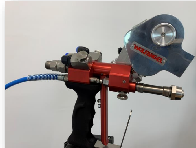
ergo.gun IC chopper gun internal mix with cutter SWII