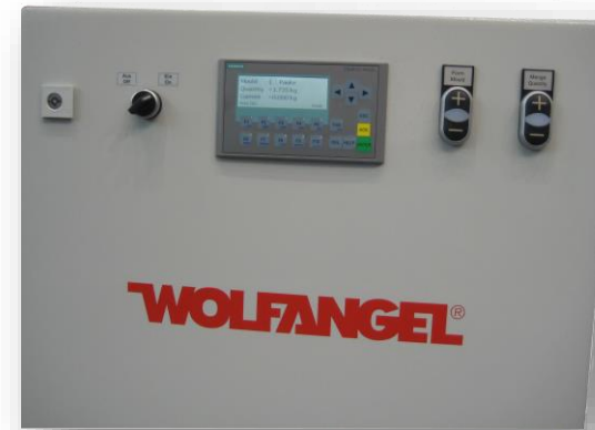
Mengenfortschrittsanzeige mit Display und Wahltastern