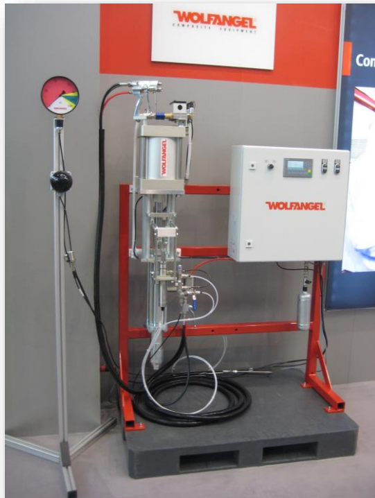
Mengenfortschrittsanzeige mit Gelcoater 150