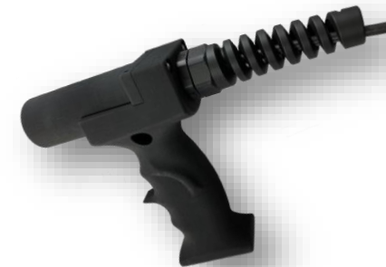
RFID-Transponder mit Ergo-Griff, kabelgebunden