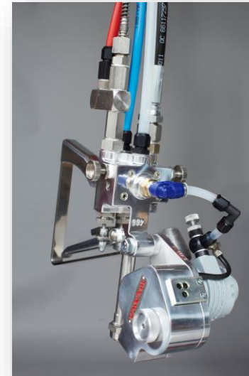
Faserspritzpistole mit Schneidwerk SW II