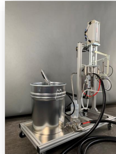
Gelcoater 44 auf fahrbarem Gestell (Serie)