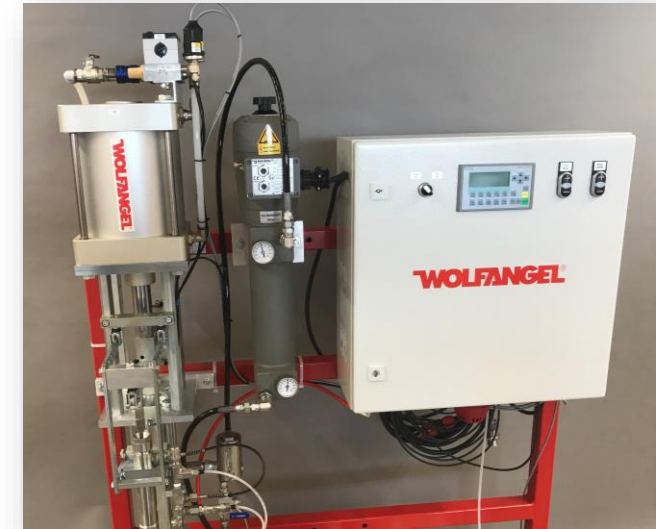
Gelcoater 150 mit optionalem Heizgerät und Mengenfortschrittsanzeige