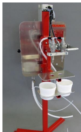
Auslässe für Harz und Härter